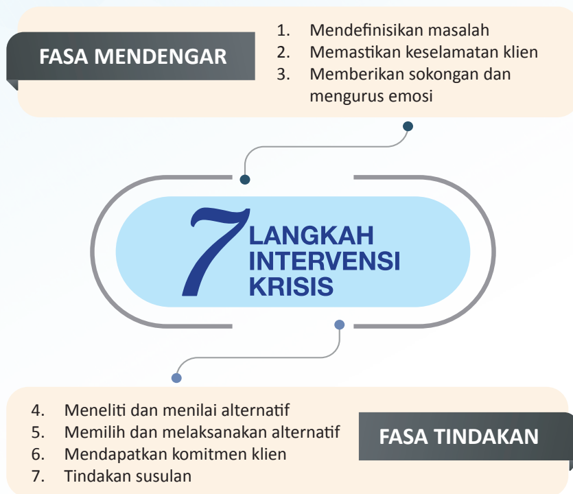
Rajah 2: Tujuh Langkah Intervensi Krisis